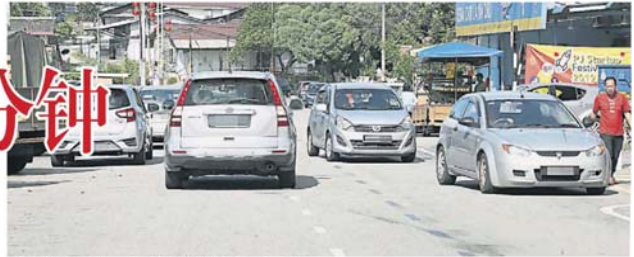
若民众双重泊车，将令道路变得狭窄，造成堵塞。

武吉加星州议员拉吉夫今早巡视当地情况指出，17 区巴刹是人潮多的地区，尤其在早市巴刹及午餐时段，很多访客到来，经常没有停车位。