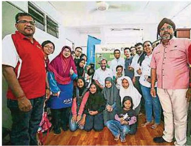
助学金受惠的学生、学生家长，与嘉宾和主办单位代表合影。