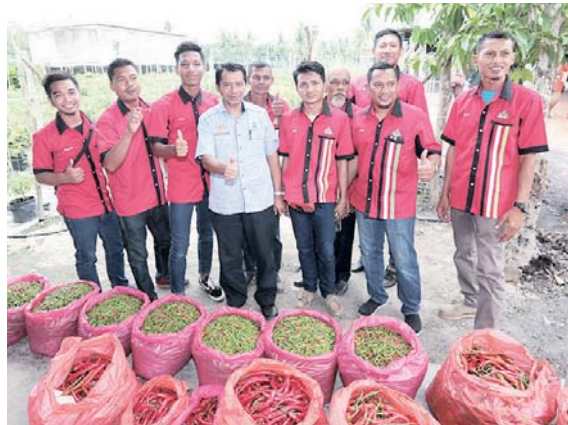
Pengerusi LPP bersama petani dari Jempol, Negeri Sembilan.

Kelab pertanian sekolah diwujudkan di sekolah-sekolah terpilih bagi memupuk minat anak-anak ke arah pertanian. Selain itu, insentif menarik serta khidmat nasihat kepada golongan belia secara berterusan turut disediakan untuk peserta mengusahakan projek-projek pertanian. - Hamzah