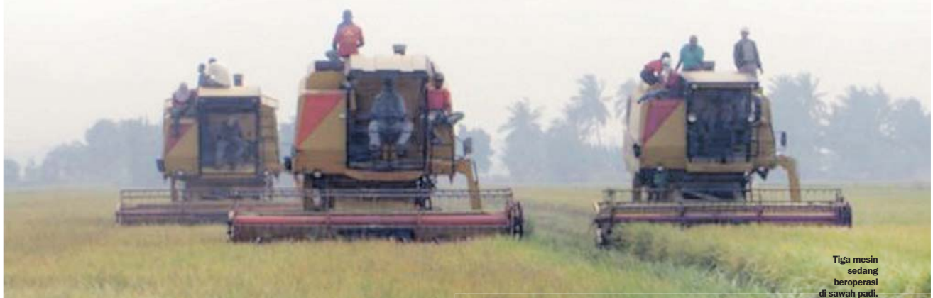
Tiga mesin sedang beroperasi di sawah padi.

S EJAK penubuhan 46 tahun, Lembaga Pertubuhan Peladang (LPP) terbukti memenuhi peranan sebagai sebuah agensi yang menyokong kuat agenda Kementerian Pertanian Dan Industri Asas Tani dalam mentransformasikan sektor pertanian.