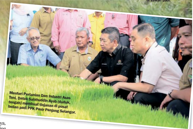
Menteri Pertanian Dan Industri Asas Tani, Datuk Salahuddin Ayub (duduk, tengah) membuat tinjauan di pusat belian padi PPK Pasir Panjang Selangor.

Dalam menghadapi cabaran dinamik yang sedang berlaku, LPP sedang melalui satu lagi evolusi, mengimbangi harapan tinggi masyarakat petani agar memenuhi peranan yang termaktub dalam akta