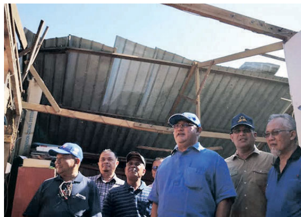
Noh (tiga, kanan) meninjau salah sebuah rumah penduduk terjejas di Kampung Seri Tiram Jaya.

“Kalau setakat hendak menempatkan sementara