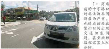
↑一商店前的十字路口的非法泊车问题最为严重，也造成该处在繁忙时间出现交通阻塞问题，甚至短程路程需塞上20分钟。